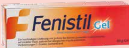
Fenistil Gel* 30 g

Wirkstoff: Diethyltoluamid. Hinweis: Biozid-Produkte vorsichtig verwenden. Vor Gebrauch stets Etikett und Produktinformation lesen.