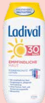
Ladival EMPFINDLICHE HAUT LSF 30 200 ml

Wirkstoff: Dimetindenmaleat. Anwendungsgebiete: Zur kurzfristigen Linderung von Juckreiz bei kleinen juckenden Insektenstichen auf intakter Haut. Juckreiz bei Hauterkrankungen wie chronischem Ekzem, Urtikaria und andere allergisch bedingte Hautkrankheiten; Verbrennungen 1. Grades, Sonnenbrand.