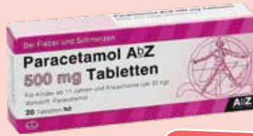
Paracetamol AbZ 500 mg Tabletten* 20 Tabletten

Anwendungsgebiete: Zur Behandlung von funktionellen und motilitätsbedingten Magen-Darm-Erkrankungen wie Reizmagens- und Reizdarmsyndrom sowie zur unterstützenden Behandlung der Beschwerden bei Magenschleimhautentzündung (Gastritis).