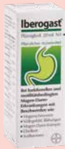
Iberogast* 20 ml