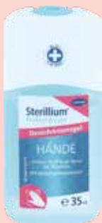
Sterillium Protect & Care Hände Gel 35 ml

Wirkstoff: Diclofenac diethylamin. Anwendungsgebiete: Zur symptomatischen Behandlung von Schmerzen bei akuten Zerrungen, Verstauchungen oder Prellungen in Folge stumpfer Traumata, z. B. Sport- u. Unfallsverletzungen der gelenknahen Weichteile (z. B. Schienbein, Sehnen, Sehnenansätze, Bänder, Muskelnansätze u. Gelenkkapseln) bei Arthrose der Knie- u. Fingergelenke, bei Epicondylitis (Entzündung der Sehnenansätze im Bereich des Ellenbogens, auch Tennisellenbogen genannt), bei akuten Muskelschmerzen z. B. im Rückenbereich. Zur Kurzzeitbehandlung bei Jugendlichen über 14 Jahre zur lokalen, symptomatischen Behandlung von Schmerzen bei akuten Prellungen, Zerrungen oder Verstauchungen infolge eines stumpfen Traumas.